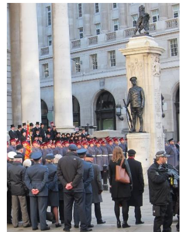
ロンドン・シティの戦死者追悼式典 (2017年11月12日)