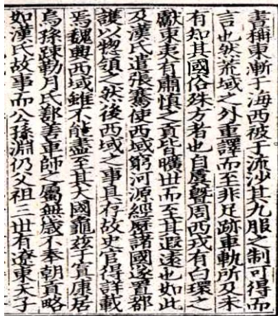
陳寿『三国志』東夷伝